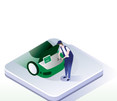
↑ Service udføres og indtastes i macsDIA