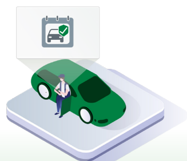
↑ Kundestyning - bilen indskrives