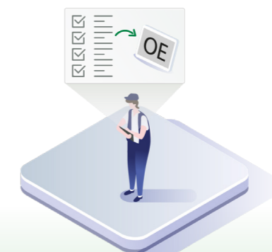
↑ Service overføres automatisk til bilproducentens serviceportal