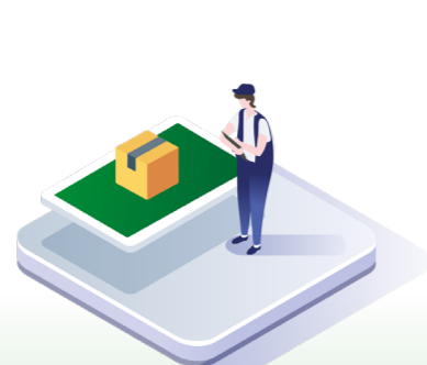
↑ Bestilling af reservedele til service