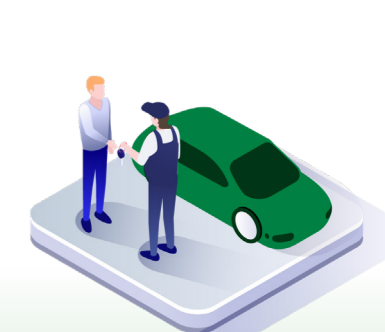
↑ Bilen afleveres til kunden